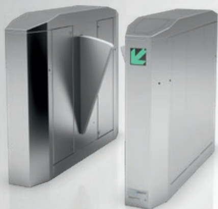
MPR с лепестковыми створкам

Скоростное решение: Лепестковые створки из пенополиуретана или акрилового стекла с чрезвычайно быстрым временем открытия.