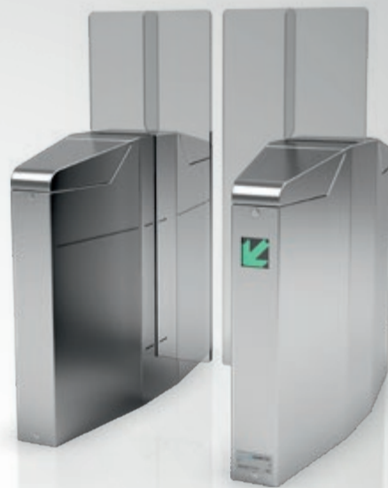
MPH с высокими створками

Защищенное решение: Турникет с высокими створками позволяет создать высокий уровень защищенности.